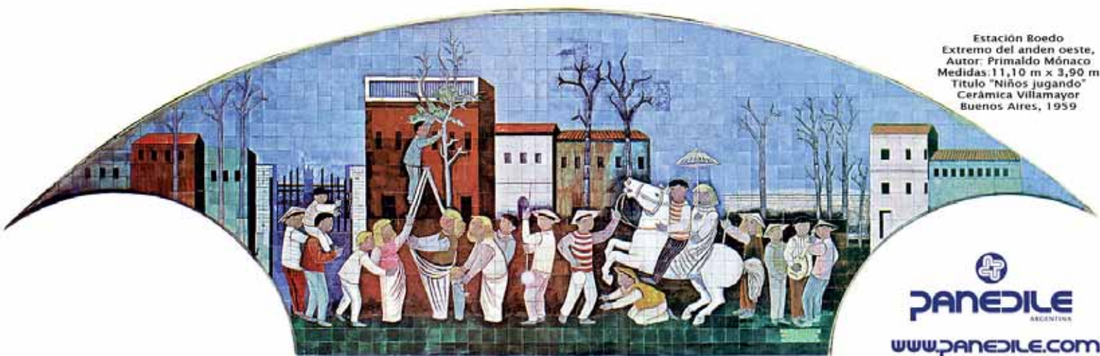
Estación Boedo Extremo del andén oeste, Autor: Primaldo Mónaco Medidas: 11,10 m x 3,90 m Título "Niños jugando" Cerámica Villamayor Buenos Aires, 1959