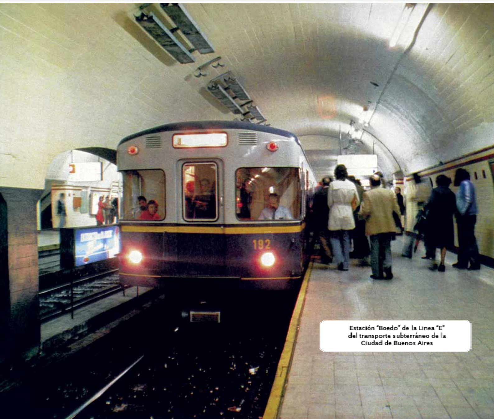
Estación "Boedo" de la Línea "E" del transporte subterráneo de la Ciudad de Buenos Aires