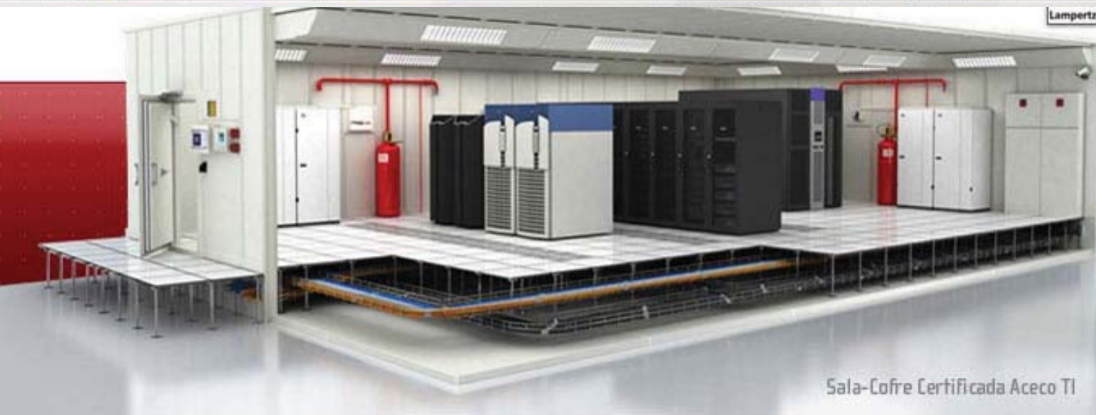
Sala-Cofre Certificada Aceco TI