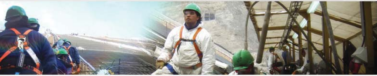
Torres Sol de Luro Ciudad de Buenos Aires República Argentina